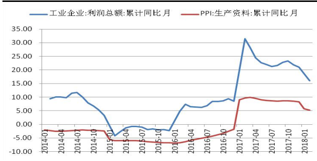
图 3：工业企业利润与 PPI 累计同比增速 (%)

也多数下降，尤其计算机通信制造业利润增速由去年的 22.9%下降至-8.2%，对制造业整体利润增速抑制作用明显。而伴随国务院常务会议提出，5 月 1 日起，对制造业等行业增速税降税的政策推动，对税务规模较大的计算机通信、汽车等高技术制造业的工业企业利润增速会有较大提升，对后期的工业企业利润保持较高增速会形成支撑，而对价格下降趋势下利润回落的改善幅度还要关注减税的力度。