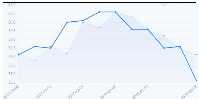
图2：欧元区制造业PMI初值（%）